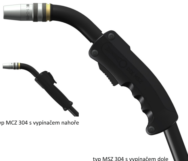
typ MCZ 304 s vypínačem nahoře